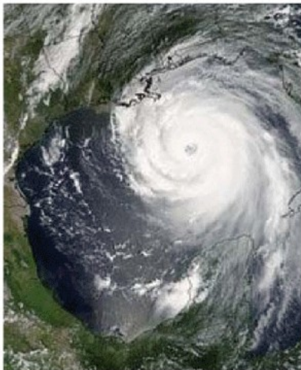
Huragan Katrina, który zmiotł Nowy Orlean.- 2005 r.

Do dziś nie mogą się pozbierać po Katrina, a minęło już 7 lat. 1836 osób poniosło śmierć. Poniesiony koszt: 81 mld $. 20 80 % miasta 21 zostało zalane!