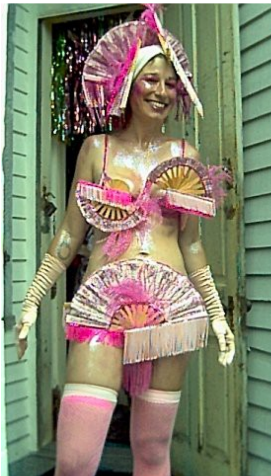
Pani na Mardi Gras 23 w 2004, tuż przed huraganem.

„A jak było za dni Noego, tak będzie i za dni Syna Człowieczego. (27) Jedli, pili, żenili się i za mąż wychodzili aż do dnia, kiedy Noe wszedł do arki i nastął potop, i wytracił wszystkich. (28) Podobnie też było za dni Lota: Jedli, pili, kupowali, sprzedawali, szczepili, budowali; (29) a w dniu kiedy Lot wyszedł z Sodomy, spadł z nieba ogień z siarką i wytracił wszystkich. ” Łukasza 17