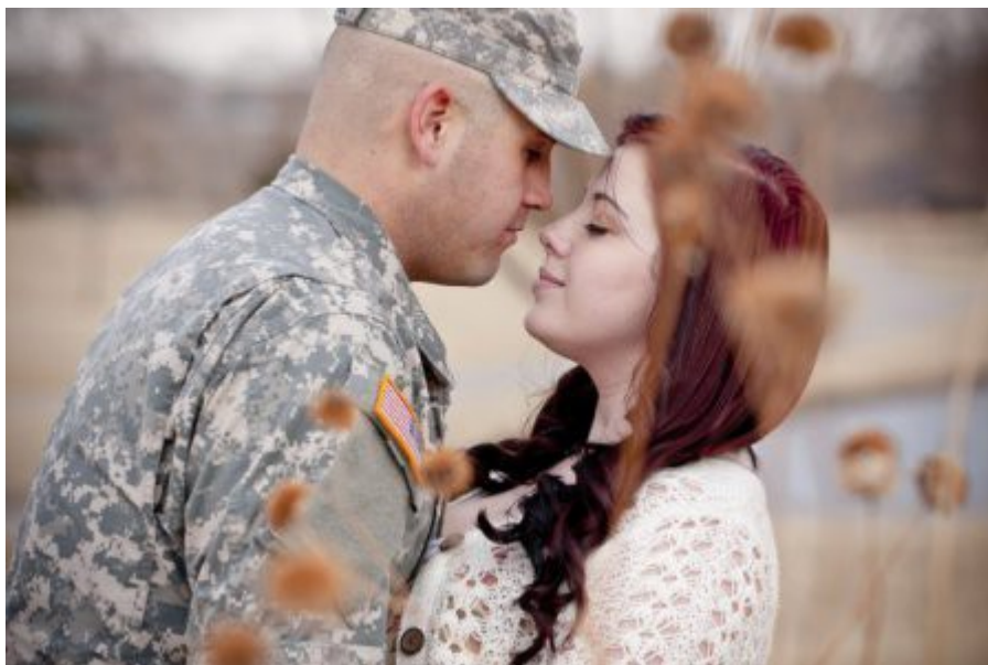
W Polsce gdy żołnierz wyjeżdża bądź przyjeżdża z konfliktu, czeka na niego jego ukochana żona. 18

W Ameryce przez Obamę, na pedała w wojsku, czeka inny pedał. To skandal i