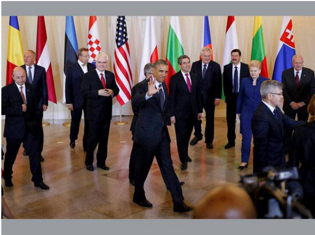
Obama spotyka się z liderami państw Europy w pałacu w Warszawie. 17