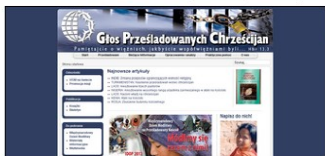
Głos prześladowanych chrześcijan

Zachęcamy także do pisania listów do ofiar prześladowań, bądź petycji do władz o usłaskawienie. Jest to możliwe, więcej na ten temat możesz dowiedzieć się wchodząc na strony: